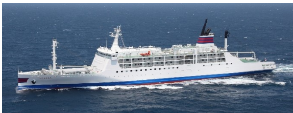
…おがさわら丸(2016年7月就航)…